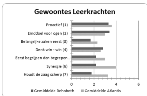
Figuur C: Gemiddelden observaties taaltes Covey leerkracht.

Aan de hand daarvan en het feit dat dit vak dagelijks en op elke school terugkomt is gekozen voor taal. In tabel E & F zijn de resultaten van deze observaties tussen de twee scholen terug te zien. Uit deze resultaten blijkt dat op basisschool Atlantis de 7 gewoontes over het algemeen meer terug te zien zijn dan bij basisschool de Rehoboth. Dit komt duidelijk naar voren bij zowel de uitslag van de leerkracht- als bij de leerling-observatie (Figuur C).